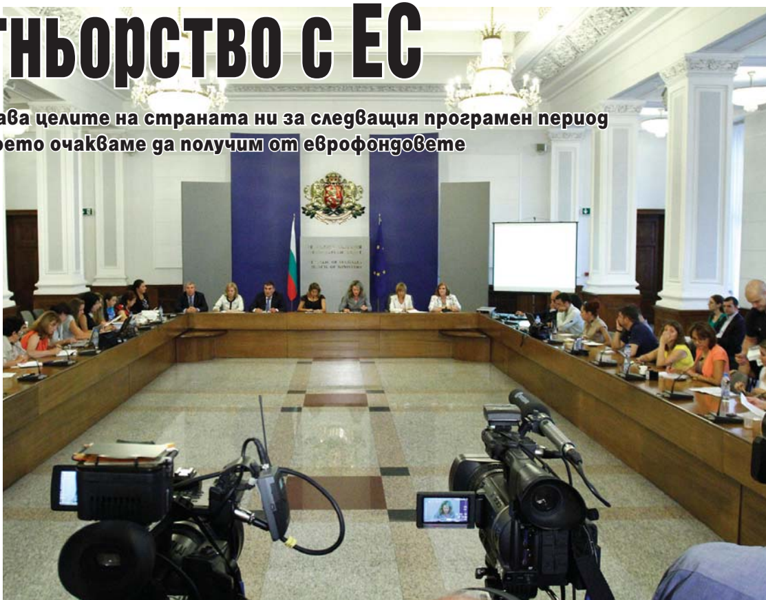
Вицепремиерът Зинаида Златанова и колегите ѝ от Министерския съвет представиха оперативните програми, по които България ще работи през 2014-2020 г., след като прие официалния вариант на договора ни с Европейския съюз