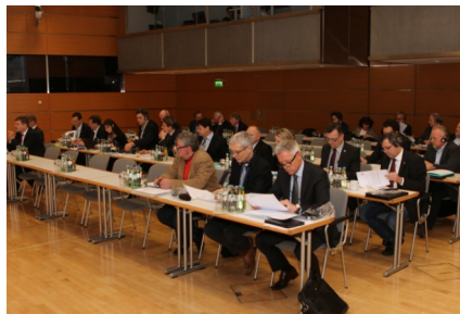
UNIEP l'Assemblée Générale 2016, Munich